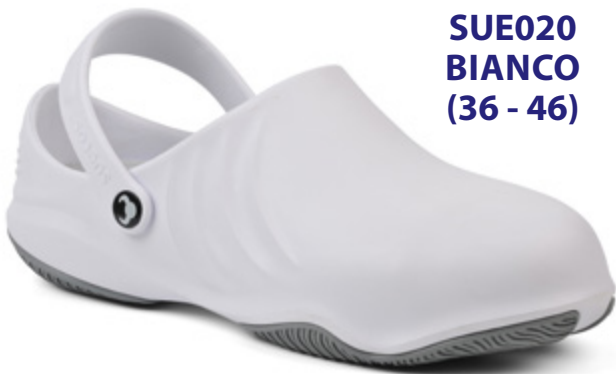
SUE020 BIANCO (36 - 46)