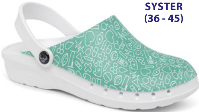
SUE005 SYSTER (36 - 45)