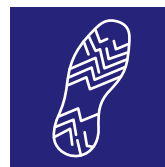
Suola antiscivolo Slip resistant sole