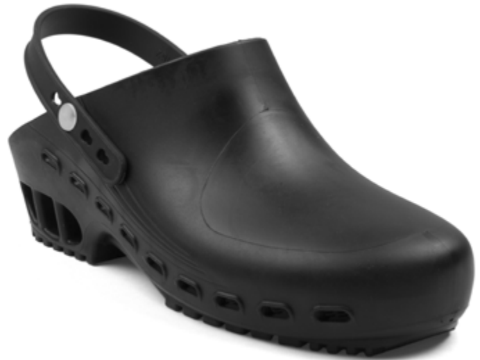
112601 ZOCCOLO AUTOCLAVABILE NERO [34-35] • [36-37] • [38-39] [40-41] • [42-43] • [44-45] • [46-47]