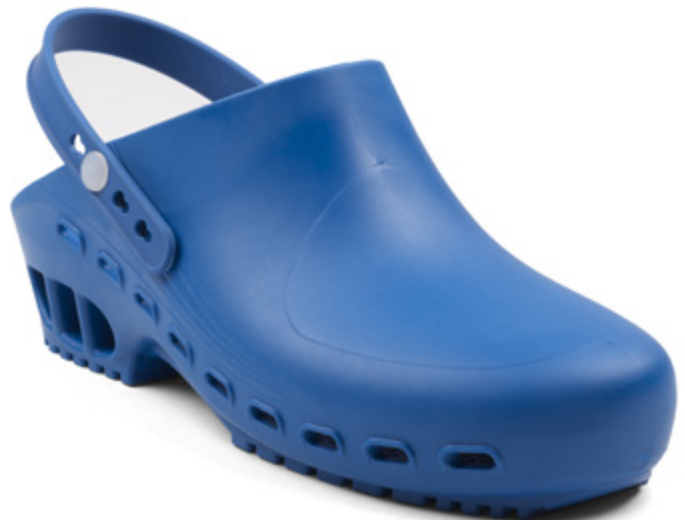
112606 ZOCCOLO AUTOCLAVABILE BLU [34-35] • [36-37] • [38-39] [40-41] • [42-43] • [44-45] • [46-47]