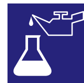
Resistente agli oli/acidi Oil/acid resistant