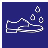
Resistente all'acqua Water resistant