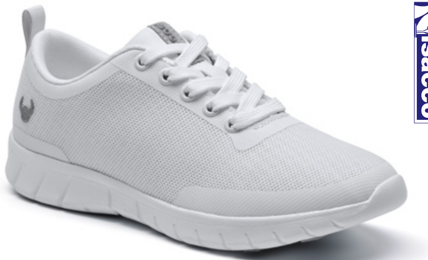
SUE040 BIANCO (36 - 46)