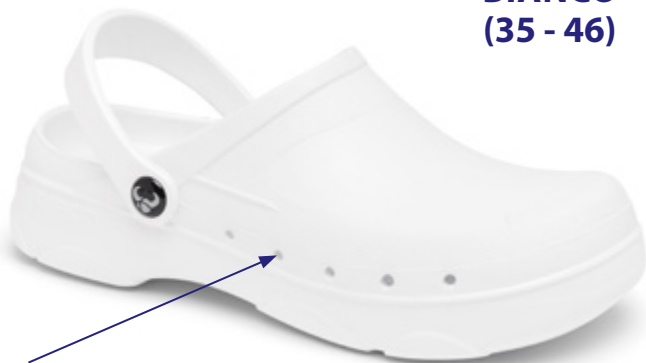
SUE000 BIANCO (35 - 46)

Fori di ventilazione che evitano l'infiltrazione dei liquidi Ventilation holes. They prevent infiltration of liquids