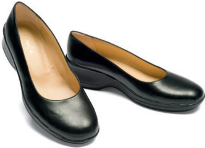
112311 SCARPA DONNA ANTISCIVOLO NERO 35 • 36 • 37 • 38 • 39 • 40 • 41