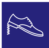
Assorbimento energia al tallone Energy absorption at the seat region