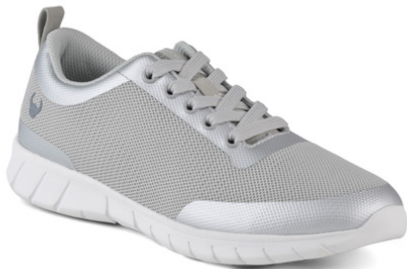
SUE049 SILVER (36 - 41)