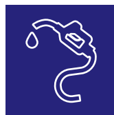
Resistente agli idrocarburi Fuel oil resistant