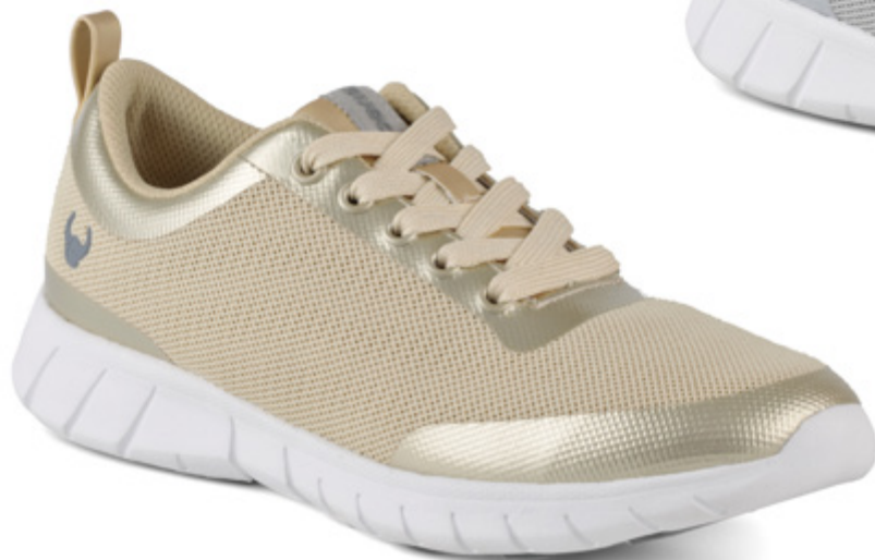
SUE048 GOLD (36 - 41)