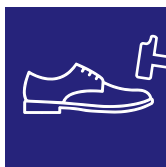
Resistenza all'urto a 200 J Impact resistance to 200 J