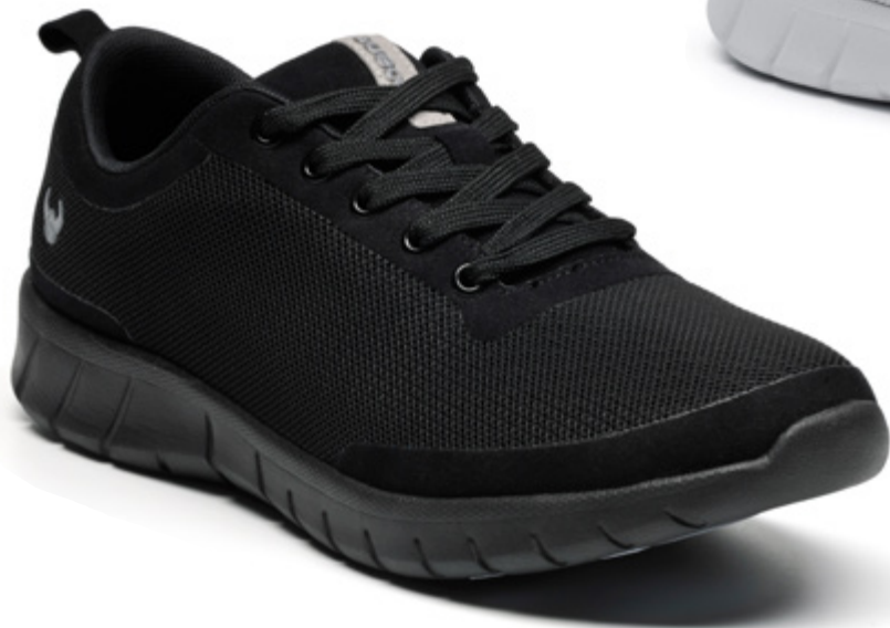
SUE041 NERO (36 - 46)