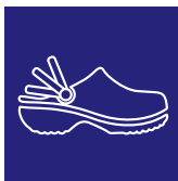
Cinturino mobile Folding heel strap