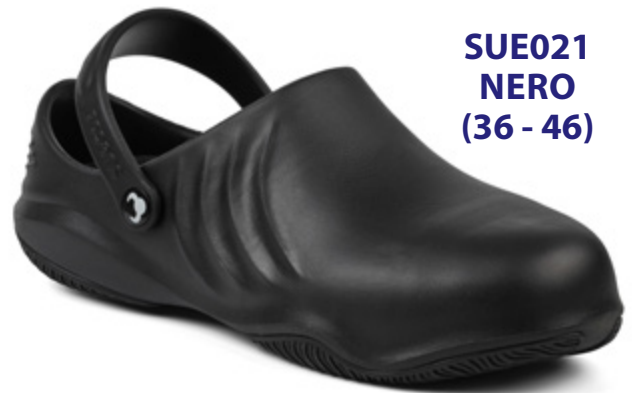
SUE021 NERO (36 - 46)

Le più leggere del mercato con un puntale resistente a 200 J ( 1500 kg) The lightest shoes on the market with toecap resistant to 200 J (1500 kg)