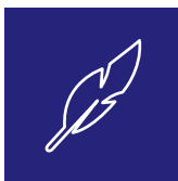
Confortevole e super leggera Comfortable and light