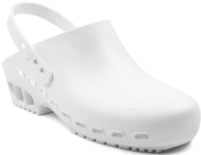
112600 ZOCCOLO AUTOCLAVABILE BIANCO [34-35] • [36-37] • [38-39] [40-41] • [42-43] • [44-45] • [46-47]

Safety class OB A E SRC EN ISO 20347:2012