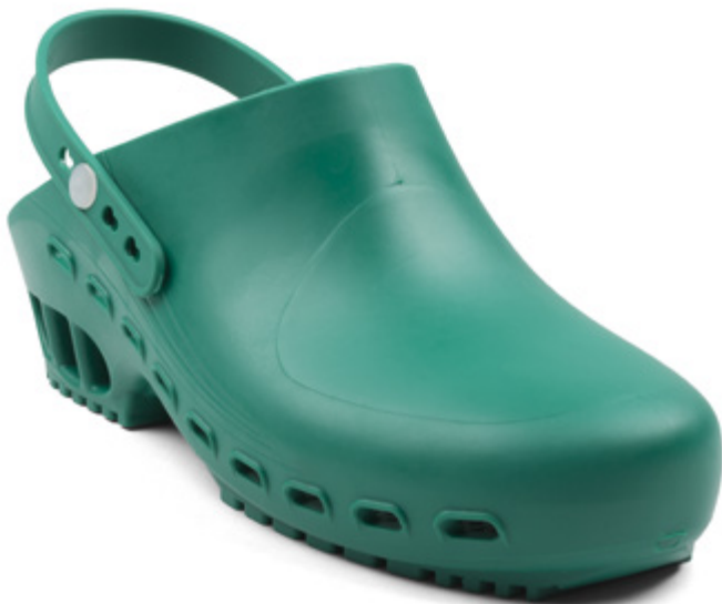
112604 ZOCCOLO AUTOCLAVABILE VERDE [34-35] • [36-37] • [38-39] [40-41] • [42-43] • [44-45] • [46-47]

Safety class OB A E SRC EN ISO 20347:2012