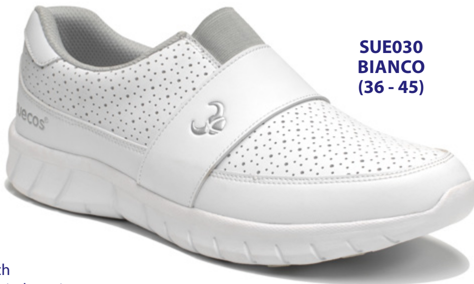
SUE030 BIANCO (36 - 45)

Fodera in CoolTech per mantenere il piede asciutto CoolTech lining to keep the foot dry