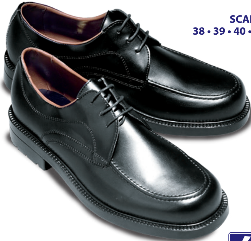
112301 SCARPA DIRECTOR NERO 38 • 39 • 40 • 41 • 42 • 43 • 44 • 45 • 46 • 47